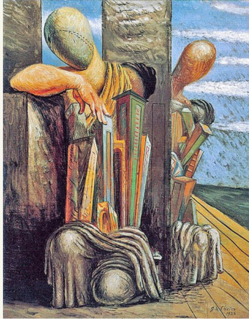
Giorgio de Chirico, Le trouble du Philosophe , 1926, Museo del Novecento, Milano

Claudio Buccolini (Iliesi CNR Roma), «numquam certis indiciis vigiliam a somno posse distingui» . Metafisica e sogno: una discussione all'Accademia di Berlino (1762)