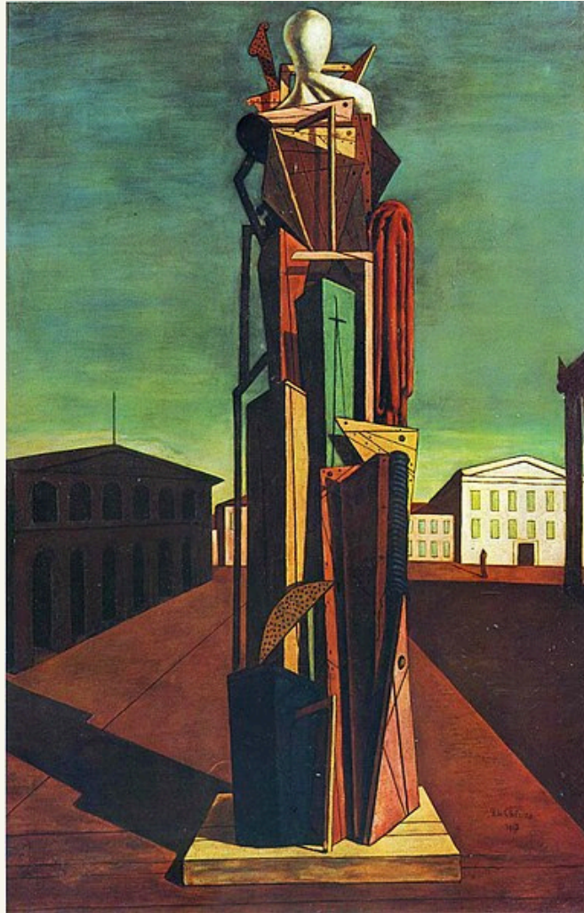
Giorgio de Chirico, Il Grande Metafisico , 1917-18, The Museum of Modern Art, New York

Gennaio-Febbraio 2025 Aula V – Villa Mirafiori Via Carlo Fea 2, Roma