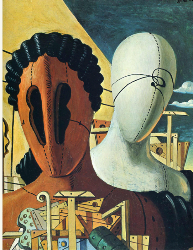
Giorgio de Chirico, Due maschere , 1916, Milano, Collezione privata