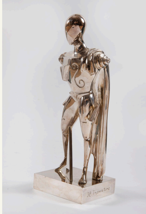
Giorgio de Chirico, Il Trovatore , Multipli, anni 70