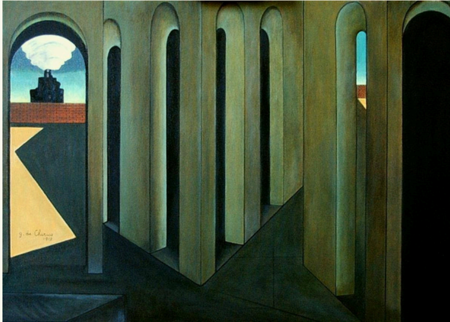
Giorgio de Chirico, Il viaggio angoscioso , 1913, The Museum of Modern Art, New York