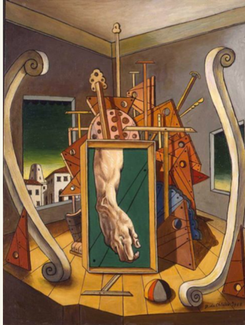
Giorgio de Chirico, Interno Metafisico con mano di David , 1968, Fondazione Giorgio e Isa de Chirico, Roma