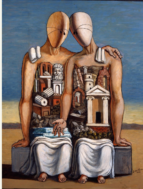
Giorgio de Chirico, Archeologi , 1968, Roma, Fondazione Giorgio e Isa De Chirico