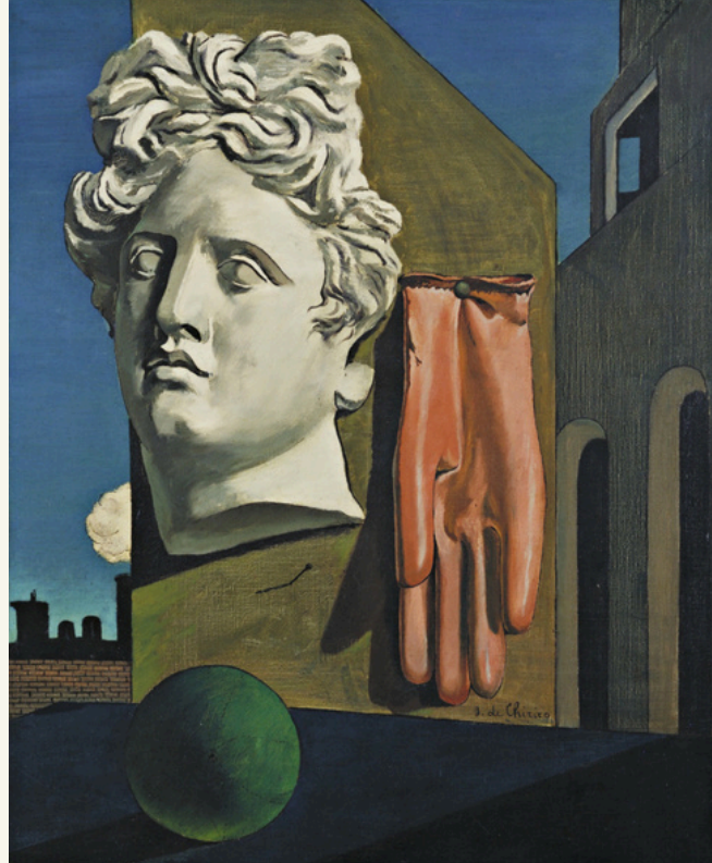
Giorgio de Chirico, Canto d'Amore , 1914, New York, The Museum of Modern Art